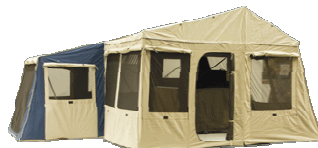
mit Vorzelt Abb. Beispiele

Vorzeltwände: Kompletter Satz Vorzeltwände für Camper 9